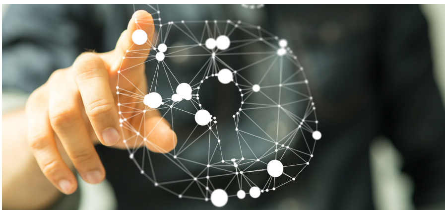
Die Digitalisierung bringt auch Risiken mit sich, die nicht ausser Acht gelassen werden dürfen

Die Digitalisierung eröffnet gerade auch für kleinere und mittelgrosse Unternehmen zahlreiche Chancen. Diese gilt es zu nutzen, ohne dabei den Sicherheitsaspekt aus den Augen zu verlieren. Denn aktuelle Beispiele zeigen, dass der Fortschritt auch zahlreiche Risiken mit sich bringt. OBT deckt den gesamten Bereich von ganzheitlichen Lösungen aus einer Hand ab und ist Ihr starker Partner auf dem Weg zur digitalen Transformation Ihres Unternehmens.